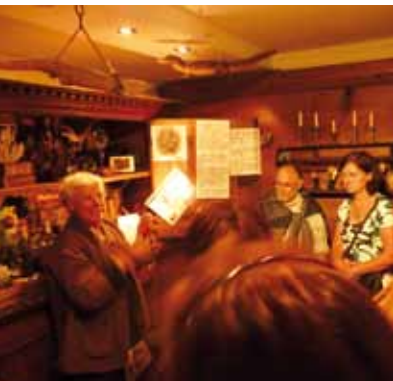
Geschichte hautnah in einem Feldkircher Antiquitätengeschäft erleben.