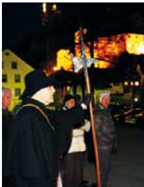
Mit Hellebarde und Horn zieht der Nachtwächter durch die Stadt.