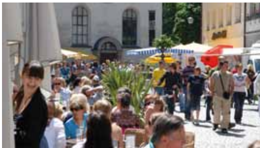
Vorarlbergs schönste Altstadt lädt zum Flanieren ein.