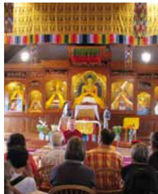
Buddhistisches Kloster am Letzehof.