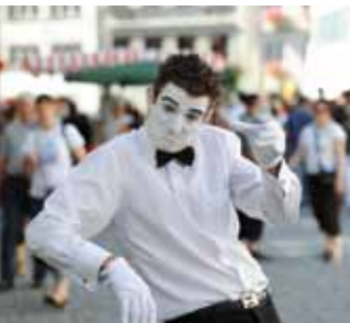
Straßenkunst beim Feldkircher Gauklerfestival.