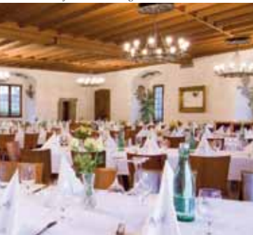
Rittersaal auf der Schattenburg