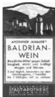
Schon früh setzte die Feldkircher Stadt-Apotheke auf den Einsatz natürlicher Heilmittel, die meist aus Eigenproduktion stammten.