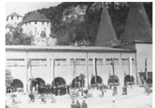
1952 fand in der Volkshalle eine Gemeinschaftsausstellung von 60 Vorarlberger Künstlern statt.

Über die erste große Kunstaussstellung Vorarlbergs nach dem II. Weltkrieg, die Ende Juli 1952 in der Volkshalle stattfand, berichtete der Anzeiger ausführlich. Es war dies eine Gemeinschaftsausstellung von 60 Vorarlberger Künstlern, die in der von den Architekten Dr. Meusburger und Ramersdorfer für diesen Zweck adaptierten Volkshalle stattfand.