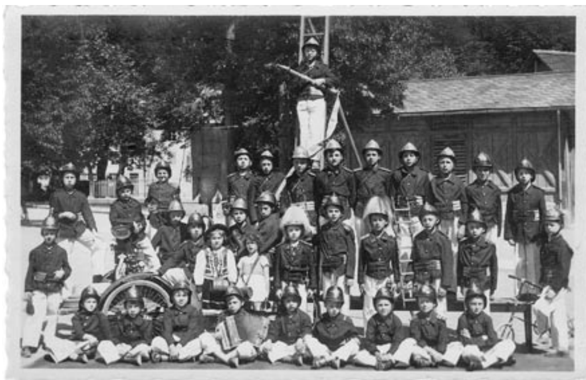
Die Jugendwehr der freiwilligen Feuerwehr Feldkirch zum 50-jährigen Gründungsfest 1934

In den 1960er Jahren wurde schließlich das Zeughaus am Zickzackweg in der Widnau errichtet, das inzwischen auch immer wieder den neuesten Erfordernissen angepasst werden muss und so ist die neue Drehleiter der Feuerwehr ein willkommener Anlass für diesen kurzen historischen Rückblick.