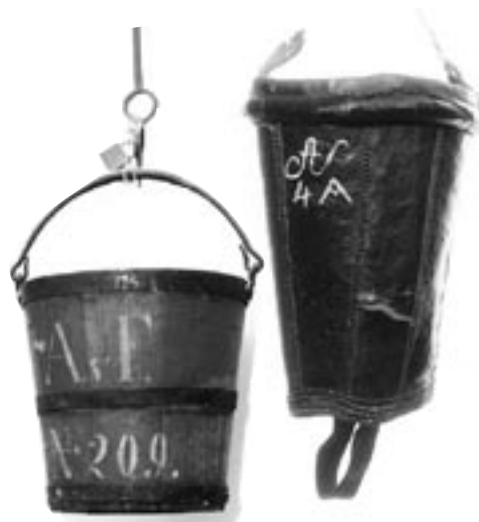
Alte Löschkübel aus dem 18. bzw. 19. Jh mit denen jedes Haus ausgestattet war.

Auf jeden Fall war 1460 ein Sündenbock gefunden und es kam in Feldkirch zu einem scheußlichen Schauprozess, bei dem die vier Beschuldigten zum Tode verurteilt wurden. Und weil das Prinzip Auge um Auge, Zahn um Zahn angewandt wurde, zündelten die Feldkircher Stadtväter nun selber. Auf dem Leonhardsplatz, in der Gegend des heutigen Illpark-Gebäudes, ließen sie einen riesigen Scheiterhaufen errichten, auf dem die Beschuldigten bei lebendigem Leib verbrannt wurden.