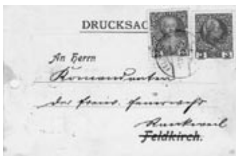
Eine Einladung zur Feuerwehrübung vom 3. Juni 1909