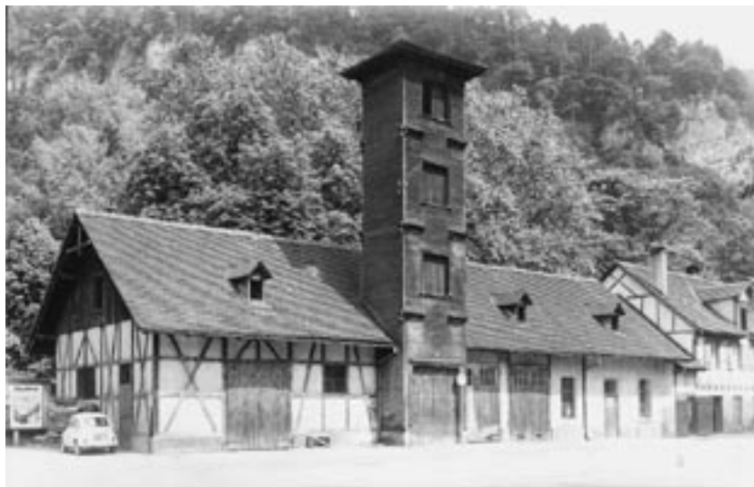
Das erste Feuerwehrhaus am Leonhardsplatz (in den 50er Jahren)

der alte Salzstadel beim Churerort zum Üben verwendet und alte Feuerwehrleute wussten seinerzeit von manchem üblen Scherz zu erzählen, den sich ihre Kameraden leisteten, etwa wenn sie bei der Übung das Sprungtuch nicht voll spannten und sich zerkugelten vor Lachen, wenn der mutige Kamerad unsanft auf dem Allerwertesten landete.