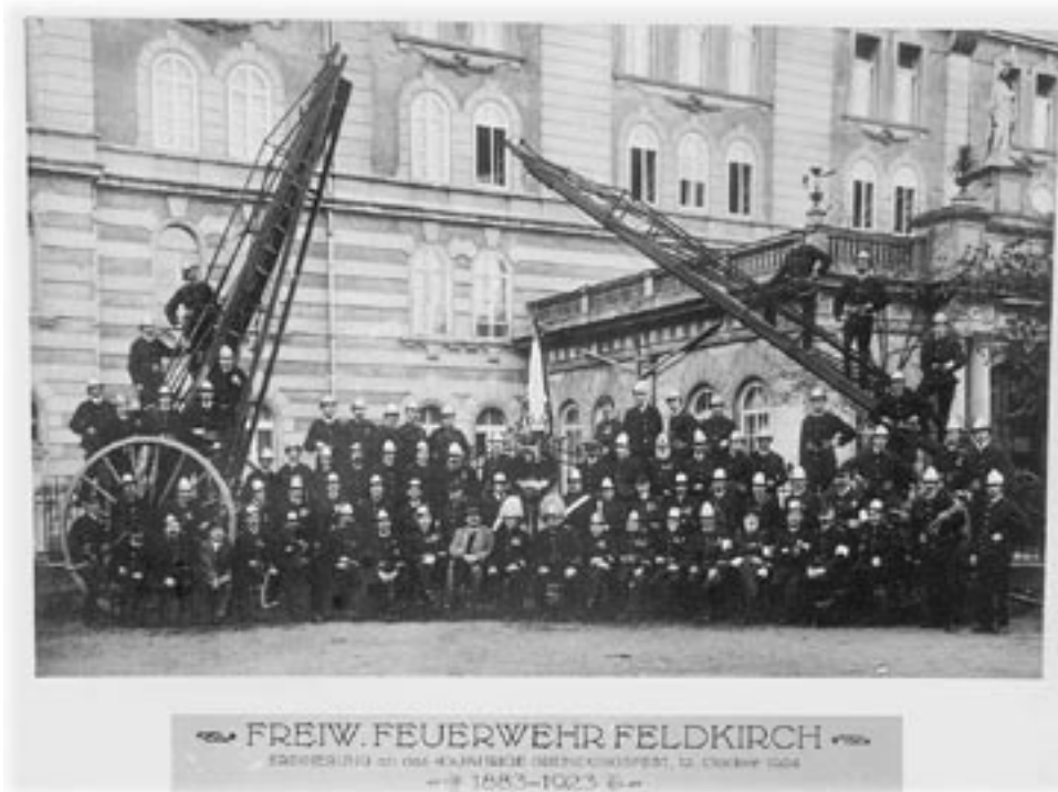
Die Feuerwehr Feldkirch Mitte der 20er Jahre mit den alten Steigleitern

Auch die Löschgeräte waren im 18. Jahrhunderts schon besser. 1741 gab es bereits vier Spritzen, zwei Tragfeuer-spritzen und zwei große auf Rädern. Immer wenn Jahrmarkt war wurden diese Spritzen zum Gaudium der Kinder öffentlich zur Schau gestellt und ausprobiert - wahrscheinlich am Johannimarkt, weil es dann heiß war und gerade recht für eine Abkühlung.