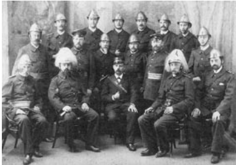
Der Ausschuss der freiwilligen Feuerwehr Feldkirch 1898