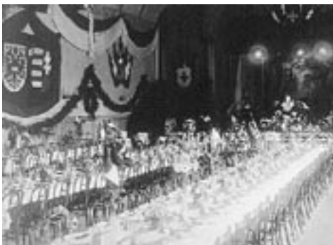
Im Saalbau wurden die heimkehrenden Kriegsinvaliden in festlichem Rahmen willkommen geheißen.

Ein weiterer Arbeitsschwerpunkt des Roten Kreuzes war die Betreuung der Invalidenaustauschzüge. Zwischen 1916 und 1918 kamen 25 solcher Austauschaktionen zustande. In italienischer Kriegsgefangenschaft befindliche österreichische Invalide wurden über die Schweiz nach Feldkirch gebracht und mit demselben Zug italienische Kriegsgefangene aus Österreich in ihre Heimat befördert. Der Empfang der österreichischen Kriegsinvaliden am Feldkircher Bahnhof war immer sehr herzlich, bestens organisiert und lief immer nach demselben Plan ab. Nach der Begrüßung durch einen hohen Offizier und Bischof Waitz marschierten die gefähigen Heimkehrer zum festlich geschmückten Saalbau (die anderen wurden transportiert), wo ihnen ein Essen serviert wurde. Mit einem Sonderzug wurden sie dann zur weiteren Genesung nach Ostösterreich transportiert.