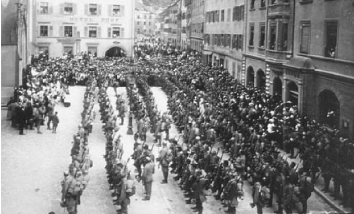
Verabschiedung der Standschützen im Kriegsjahr 1915.

Vor 80 Jahren ging der I. Weltkrieg zu Ende. Vier Jahre lang hatten sich die europäischen Großmächte bekämpft, Millionen von Menschenleben waren zu beklagen. Dieses traurige Jubiläum sei Anlass, die wichtigsten Ereignisse in Feldkirch während der Jahre 1914 bis 1918 darzustellen.