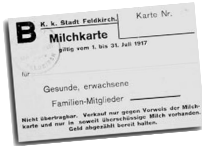
Im Laufe des Krieges wurde Milch nur noch an Kleinkinder und Kranke abgegeben.