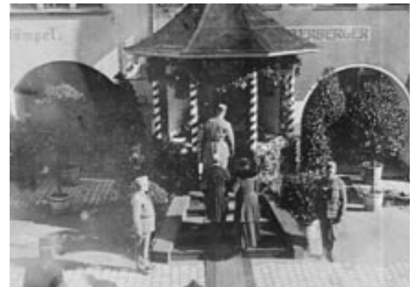
Am 22.10.1916 schlug Erzherzog Franz Salvator den ersten Nagel in das Wehrschild, welches heute im Rathaussaal hängt. Der Erlös aus dem Verkauf der Nägel diente der Unterstützung von Witwen und Waisen.