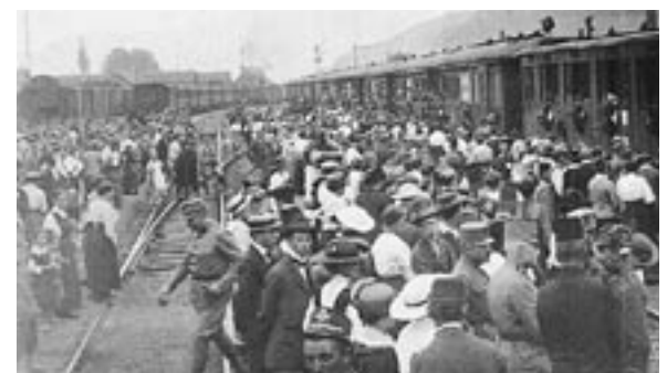
Am Feldkircher Bahnhof wurden österreichische Kriegsinvalide empfangen.

Die Versorgung der verletzten Soldaten übernahm das Rote Kreuz Feldkirch, in dem sehr viele Frauen aus allen Schichten freiwillig mitarbeiteten. Im bei Kriegsbeginn noch gar nicht eröffneten Waisenhaus - dem heutigen Graf Hugo - befand sich die Werkstätte des Roten Kreuzes, in dem Verbandstoffe und Kleidungsstücke für die Lazarette hergestellt wurden.