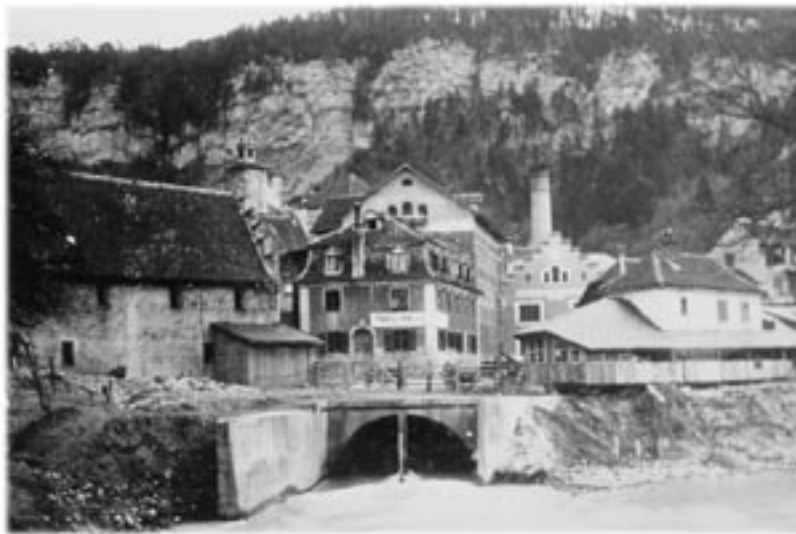
Ein Wasserauslauf auf Höhe des Elisabethplatzes. Rechts die Säge der Firma Pümpel. Der Kamin im Hintergrund befand sich beim Kraftwerk.

Die Arbeit in der Mühle war sehr hart und anstrengend. Die Arbeitszeit hing unter anderem auch vom Wasserangebot ab. Bei Niedrigwasser musste die Arbeit eingestellt, bei guter Wasserversorgung und starker Nachfrage dagegen Tag und Nacht gearbeitet werden. Im Winter froh das Mühlrad oft ein und musste vom Eis befreit werden. Eine feuchte und kalte Arbeit. Auch bei Tauwetter nach einem harten Winter war die Mühle gefährdet. Durch das Aufbrechen der Eisschicht in der Ill konnten Eisschollen die Mühle zerstören. 1799 gelang es nur durch den Einsatz von in der Stadt einquartiertem Militär die Mühle vor einem solchen Eisstoß zu retten. Jeder Soldat erhielt ein kleines Geldgeschenk für seine Mithilfe überreicht.