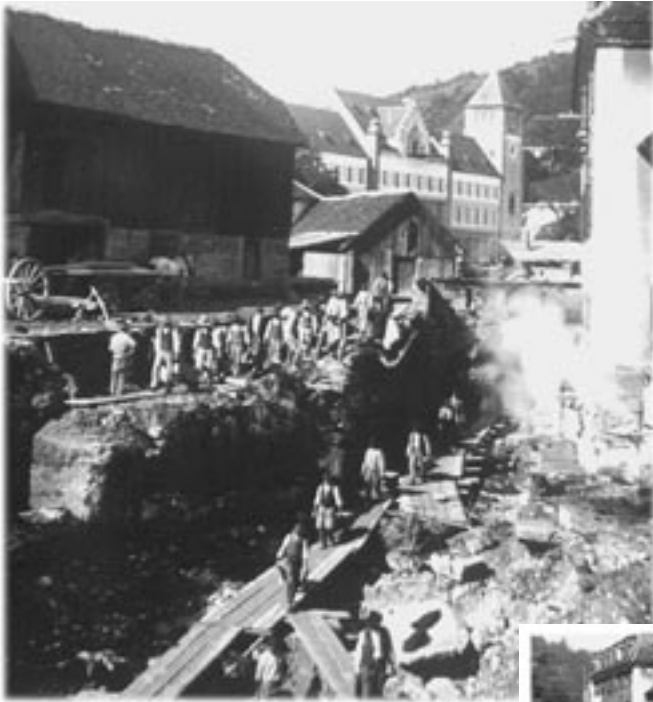
Aushubarbeiten für das E-Werk 1905 nach dem Abriss der alten Mühle