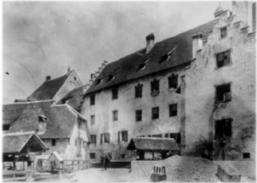
1830 erwarb Feldkirch die Mühle aus Staatsbesitz.

Wichtigster und ältester Gewerbebetrieb an diesem Mühlekanal, und natürlich auch namensgebend, war die Stadtmühle, die sich an Stelle des heutigen Elektrizitätswerkes befand. Sie gehörte ursprünglich dem Stadt- bzw. dem Landesherren. Erst Kaiser Maximilian verlieh diese Mühle und das Wasserrecht 1495 an die Stadt Feldkirch, die dafür jährlich 200 Gulden als Lehenszins an den Landesherren, später an den Staat bezahlte. Erst 1830 erwarben die Feldkircher die Mühle aus Staatsbesitz. Laut dem Lehenbrief vom Jahre 1495 blieben die Fischereirechte beim Landesherren und übernahm die Stadt die Verpflichtung, die Ill zu wahren, d.h. für den Bau von Hochwasserschutzdämmen zu sorgen.