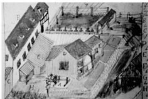
Die alte Stadtmühle, Einreichplan aus dem Jahr 1795. Im Hintergrund der Mühlegumpen mit Wasserfall, ganz rechts eine Hanfreibe.