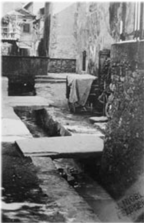
Der offene Entenbach auf Höhe der Buchhandlung Pröll, im Hintergrund der Erker des Gasthaus Alpenrose.