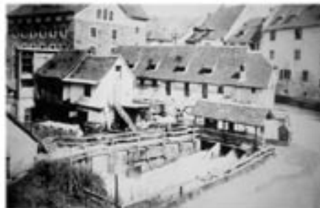
Die Feldkircher waren bis ins 19. Jh. verpflichtet, ihr Getreide in der Stadtmühle mahlen zu lassen.