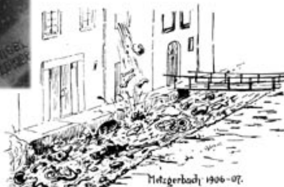
Zeitgenössische Karikatur auf die „Hygiene“ der Stadtbäche.

Die Bürger wiederum durften nur hier ihr Getreide mahlen lassen, es handelte sich also um eine sogenannte Zwangs- oder Bannmühle. Der Stadtrat wiederholte immer wieder diese Bestimmung und verurteilte Bürger zu Geldstrafen, die ihr Korn andernorts mahlen ließen. Diese Monopolstellung blieb bis in das 19. Jahrhundert hinein bestehen.