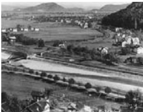
Tennisanlage am Breiten Wasen, 1927 bis 1967