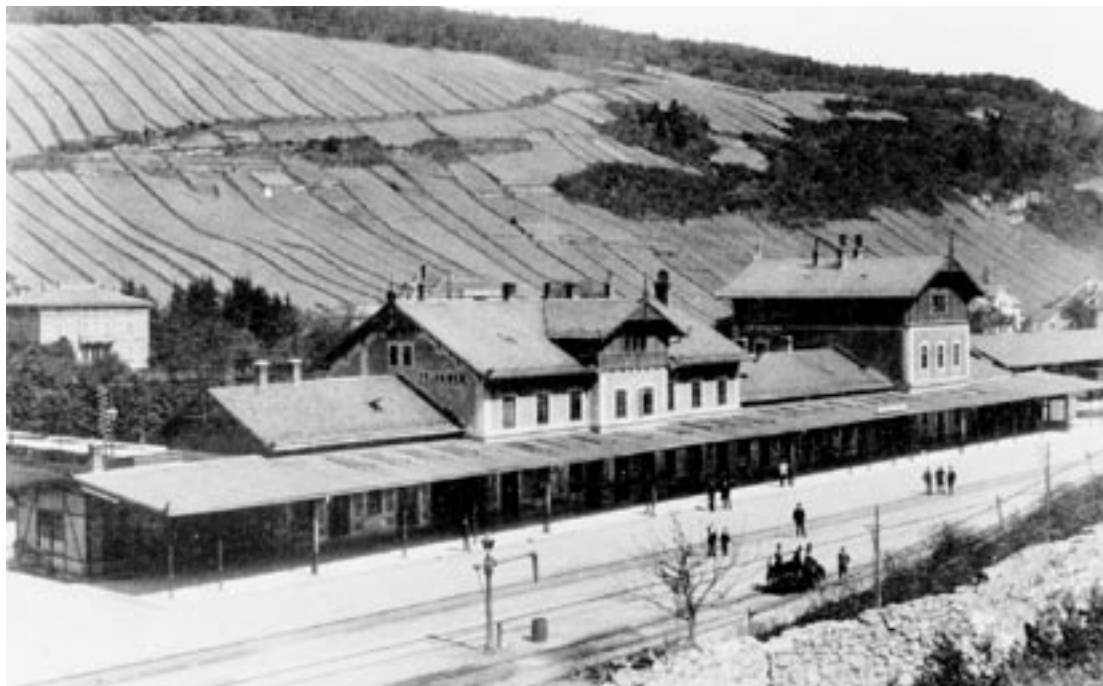
Erst 1886 zeigten Stadt- und Bahnuhr die gleiche Zeit an.

Diese verschiedenen Ortszeiten bereiteten nunmehr den Eisenbahnen bei den Fahrplänen und den Telegrafentarn bei der Nachrichtenübermittlung immer wieder Probleme. Missverständnisse, ja sogar Unfälle waren die Folge. Um dies zu vermeiden, führte man