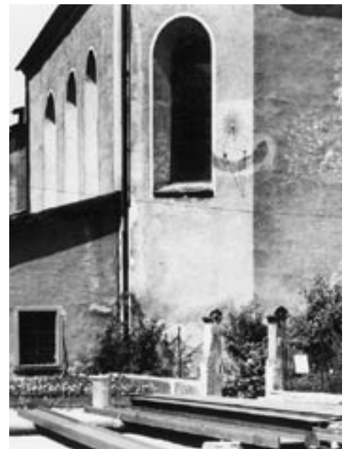
Auch an der Johanneskirche befand sich früher eine Sonnenuhr

Am 21. Jänner 1838 berichtet Kreishauptmann Ebner in seinem Tagebuch: „... plötzlich wurde die Bregenzeruhr, die gestern noch viel zu früh ging, um eine volle halbe Stunde zurückgehalten!“ 1848 stellt Ebner in einer anderen Tagebucheintragung fest, dass die Uhren der beiden Städte Bregenz und Feldkirch „beinahe um \frac{3}{4} Stunden differieren.“ Hier ist allerdings nicht ganz klar, ob dem nicht auch noch ein anderer Sachverhalt zugrunde liegt, nämlich der, dass sich Bregenz und Feldkirch schon damals nach verschiedenen Ortszeiten richteten,