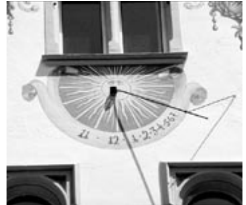
Eine schöne Sonnenuhr ist in der Marktgasse am Schertlerhaus zu bewundern.

Zu Beginn des 19. Jh. waren die mechanischen Uhren schon sehr verbreitet und sie waren auch recht genau geworden. Trotzdem bemühte man sich damals in Vorarlberg nur wenig darum, dass die öffentlichen Uhren die Zeit genau anzeigten. Das lassen einige schriftliche Aufzeichnungen aus jener Zeit erkennen.