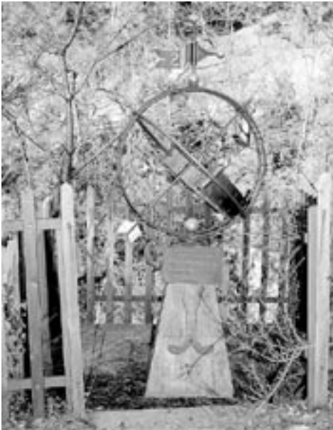
Eine Sonnenuhr zu Ehren von Joachim Rheticus ist am Veitskapf zu finden.

Wenn man also aus einer Sonnenuhrenablesung die heute gebräuchliche MEZ ermitteln will, so muss man hier in Feldkirch zunächst zur Sonnenuhrenzeit die 22 Minuten Verspätung gegenüber der Zeit auf dem 15. Längengrad dazu zählen. Für die genaue MEZ ist noch zusätzlich der genaue Wert der „Zeitgleichung“ zu berücksichtigen. Dieser Korrekturwert ist in den so genannten Zeitgleichungstabellen angegeben und beispielsweise auch in astronomischen Jahrbüchern zu finden.