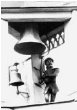
Noch bis 1911 gingen auch für den Bläsi am Giebel der Johanniterkirche die Uhren anders.

Die Probleme wurden dann im Jahre 1891 dadurch gelöst, dass man die internationalen Zeitzonen einführt. Im Abstand von 15 Längengraden wurden (unter Berücksichtigung der Landesgrenzen) Zeitzonen eingeführt, die sich jeweils um genau 1 Stunde unterschieden. Mitteleuropa erhielt dabei die Ortszeit des 15. östlichen Längengrades als mitteleuropäische Zeit (MEZ) zugeteilt. Die Eisenbahnen in Österreich-Ungarn und in Süddeutschland führten diese Regelung noch im gleichen Jahr ein. Die Umstellung der öffentlichen Uhren in den verschiedenen Städten ließ aber zum Teil noch lange auf sich warten.