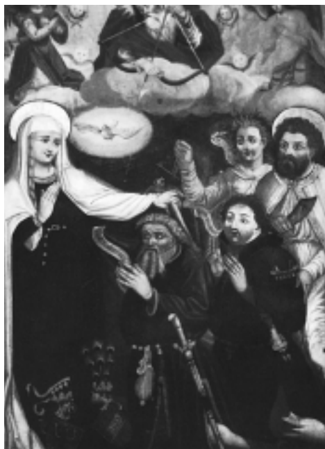
Die einzige erhaltene Abbildung von Herzog Friedrich IV „mit der leeren Tasche“ (Bildmitte)

Der Feldkircher Stadtrat, seit den Freiheitsbriefen des letzten Montforters in einer starken Position, war politisch rege. 1391 gründeten Feldkirch und Bludenz die sog. Feldkircher Eidgenossenschaft,