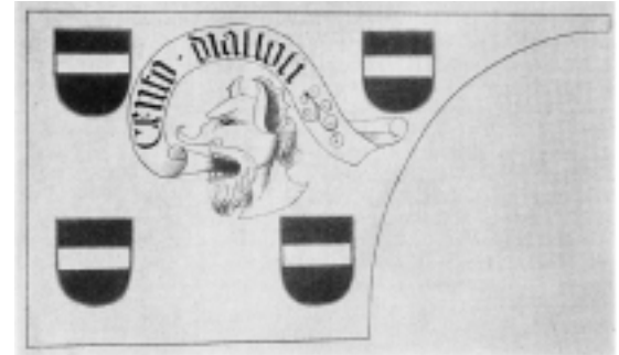
Die Fahne der italienischen Söldner im habsburgischen Dienst, vom Bund ob dem See im Gefecht bei Imst 1406 erbeutet (Cento diavoli = hundert Teufel).