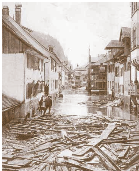
Treibholz hat sich in der überschwemmten Vorstadt aufgestaut.