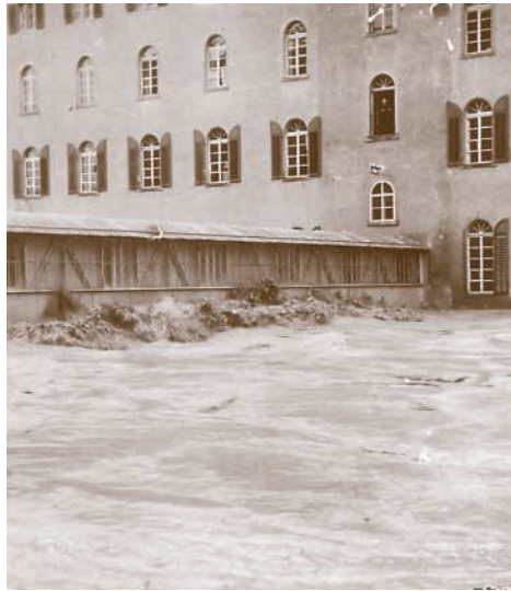
Am 15. Juni wurde die Brücke der Stella vom Wasser mitgerissen.