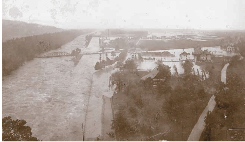
Auch Gisingen wurde vom Hochwasser heimgesucht.

Am Sonntag, dem 19. Juni strömten zahlreiche Neugierige, „Gaffer“ mit dem Zug nach Feldkirch. Aus Richtung Bludenz war aber an der provisorischen Haltestelle Felsenau Schluss. Vom Bahngeleise erreichten die Neugierigen, im Gänsemarsch, über einen Holzsteg die Felsenaubrücke und wanderten auf den Stadtschrofen, um einen Blick auf die überschwemmten Gebiete im Walgau und auf Feldkirch zu werfen. In Feldkirch selbst hatten die fleißig den Schlamm wegschaufelnden Arbeiter Zuschauer, die ebenfalls per Zug aus dem Unterland einen Katastrophen-Ausflug gemacht hatten. Schlamm und Schotter wurden per Pferdewagen zur Ill gekarrt und dort entsorgt. Zumindest die Feldkircher Gastronomen und die Bahnverwaltung hatten an diesen Ausflüglern ihre Freude.