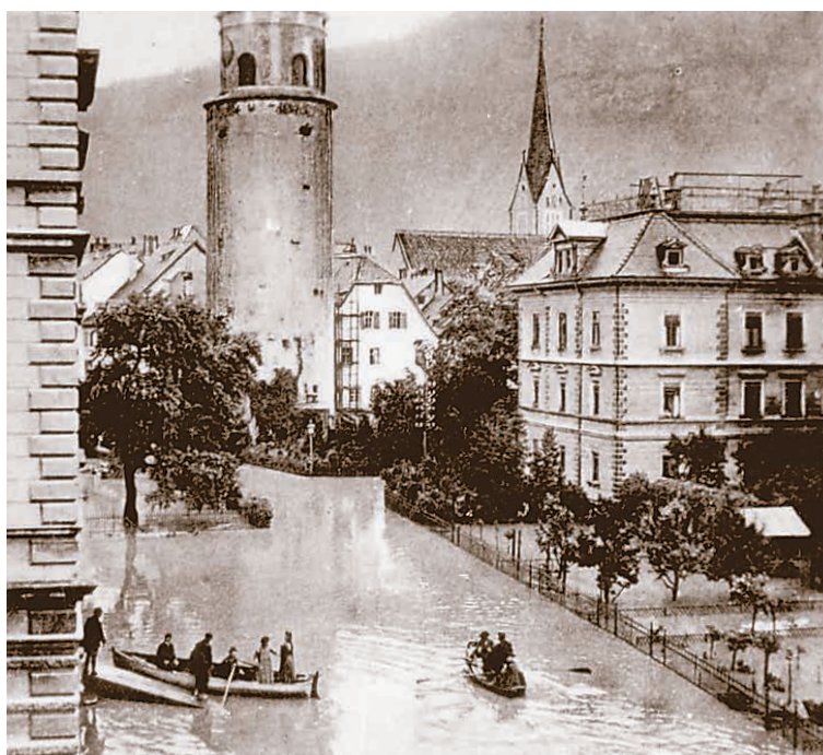
Hirschgraben: Matrosen evakuieren mit Booten die Bevölkerung.

heute nicht mehr existierenden Gebäude rechts der Ill, sickerte bereits am 14. Juni Wasser aus den Kanalschächten in den Keller. Die Schüler versuchten mit Pumpen das Wasser zurückzuhalten. Gegen 11 Uhr abends gab man den Kampf um den Altbau auf und versuchte den Neubau, das heutige Landeskonservatorium zu retten. Auch dort drang Wasser aus der Kanalisation in das Gebäude. Um Mitternacht war die ganze Breite des Flusses mit treibenden Baumstämmen derart bedeckt, dass man das Wasser gar nicht mehr sehen konnte. Diese Stämme stammten aus dem städtischen Holzlager in der Felsenau, das durch die Ill zerstört worden war. Um drei Uhr des 15. Juni wurde die Brücke zwischen Alt- und Neubau vom Hochwasser weggerissen. Patres und Schüler versuchten noch während der Nacht im Theatersaal Billardtisch und Klavier zu retten, auch die Bibliotheksbestände wurden in höher gelegene Räume in Sicherheit gebracht. Um 9 Uhr verließen die Schüler die Stella Matutina und brachten sich in Sicherheit. Noch am selben Tag wurde das Schuljahr für beendet erklärt und die Schüler nach Hause entlassen.