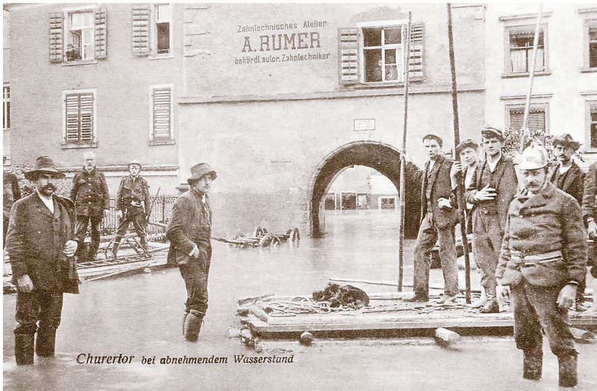
Feuerwehr und Freiwillige auf Flößen vor dem Churertor.

Für die Bewohner der Stadt Feldkirch brachte die Ill großen Nutzen. Sie bedrohte viele Bürger aber auch immer wieder in ihrer Existenz. Nach dem Jahrtausendhochwasser 1762 gab es 1871, 1879 und 1890 Überschwemmungen, von denen vor allem die Vorstadt betroffen war. Am 15. Juni 1910 trat die Ill aus ihrem Bett und richtete hauptsächlich im Montafon und in Feldkirch schwerste Schäden an.