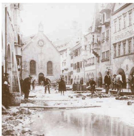
Nach dem Hochwasser: Aufräumarbeiten in der oberen Markt- gasse.

Obwohl die Stadtwerke sofort nach dem Rückgang des Wassers mit den Aufräume- und Reparaturarbeiten begonnen haben, blieb Feldkirch ohne Strom. Die Spinnerei Rosenthal in Rankweil lieferte Notstrom nach Feldkirch und in das Vorderland. Nach der Reparatur von zumindest einem Generator konnte das Elektrizitätswerk am 25. Juni die Stromerzeugung provisorisch wieder aufnehmen. Die unterbrochene Hochdruckleitung aus der Samina konnte am 19. Juni wieder in Betrieb genommen werden. Das Wasser aus dieser Hochdruckleitung wurde dringend für die Reinigung der verschlammten Straßen benötigt.