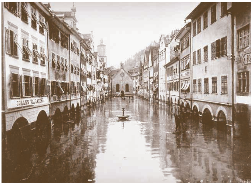
Die Markt- gasse unter Wasser

Dampfmaschine die Generatoren anzutreiben. Um 3 Uhr morgens des 15. Juni drang Wasser in den verbarrikierten Maschinenraum ein. Dieser war dann bis zu drei Metern geflutet. Das Wasser reichte bis zum oberen Rand der Schalttafel. Auch das unterhalb des Hochwuhrs gelegene Gaswerk und die in voller Glut-hitze stehenden Gasöfen wurden überflutet.