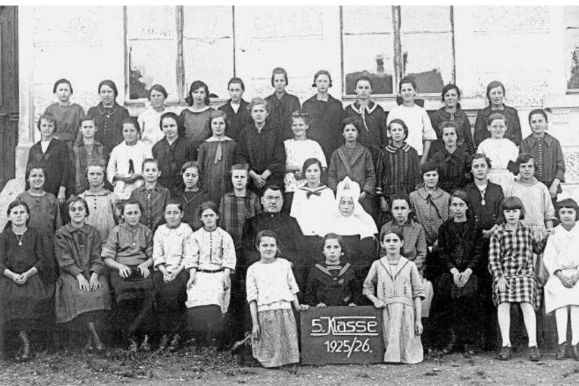
Die 5. Klasse des Jahrgangs 1925/26.

1944 Wegen anhaltender Kälte und Kohlenmangel gibt es mehr als zwei Monate „Kälteferien“. Seit April 1944 dient der Turnsaal als Notquartier für Flüchtlingsfamilien aus Ostösterreich.