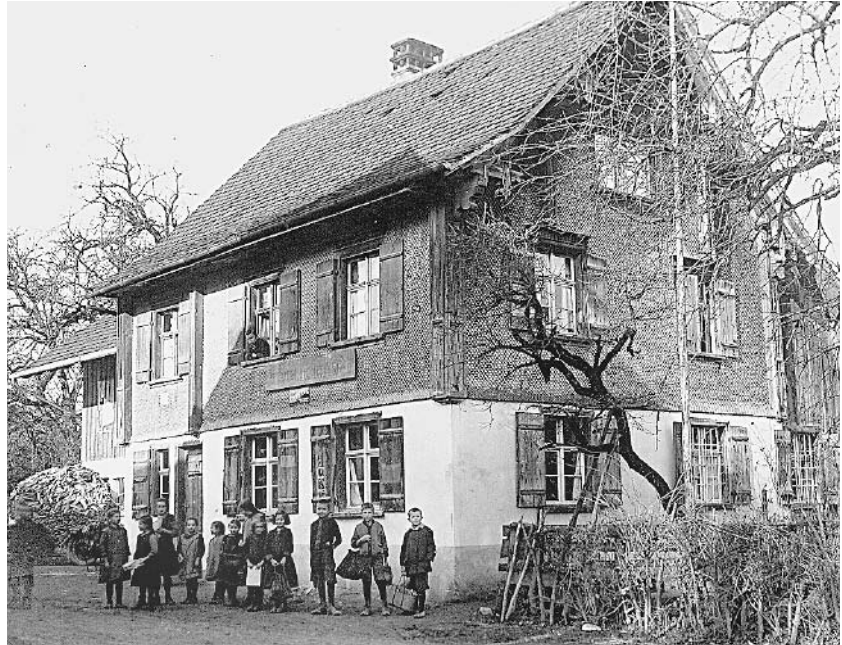
1798 kaufte die Gemeinde ein eigenes Schulhaus, das bis 1832 in Betrieb war. Es stand dort, wo heute der Parkplatz der Raiffeisenbank ist.

1798 Die Gemeinde Altenstadt, zu der ja Gisingen damals gehörte, kaufte den Grund für ein eigenes Schulhaus von Simon Schatzmann um 80 Gulden. In diesem Schulhaus wurde bis 1832 unterrichtet. Es befand sich auf dem Areal des heutigen Parkplatzes der Raiffeisenbank.