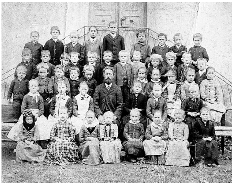
Gisinger Schulkinder im Jahre 1891 vor der damaligen Volksschule (heute ist in diesem Gebäude die Post untergebracht).