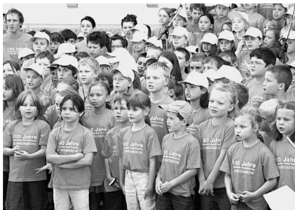
Die gelungene 100-Jahr-Feier am 23. Juni mit gleichzeitiger Eröffnung des neu gestalteten Ortszentrums.