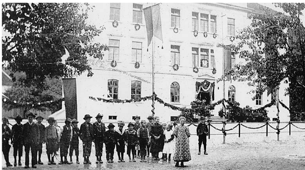
Die neue Volksschule Sebastianplatz kostete einschließlich Baugrund 90.000 Kronen - damals eine enorme Summe.

Insgesamt kostete das Schulhaus samt Baugrund 90.000 Kronen.