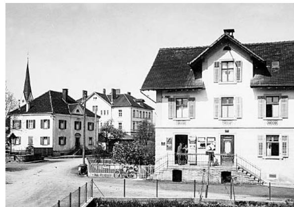
Das Gisinger Ortszentrum anno dazumal, im Hintergrund die Volksschule.

1942 Wegen Kohlenmangel sind vom 26. Jänner bis 21. Februar „Kohlenferien“.