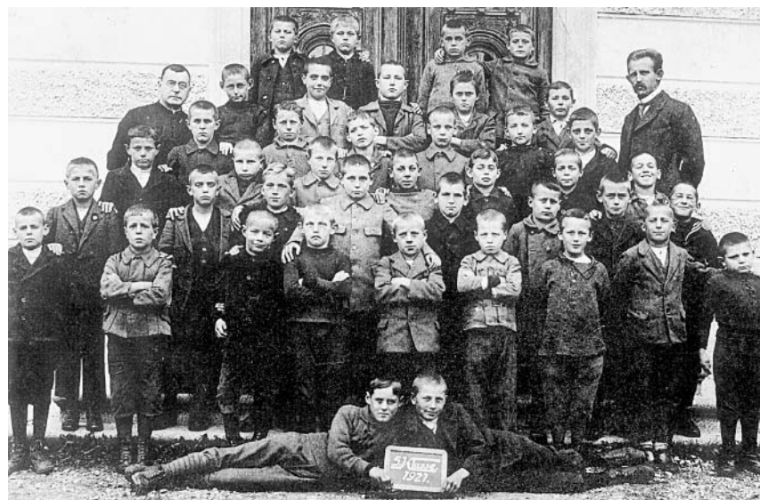
Die 5. Klasse des Jahrgangs 1927.